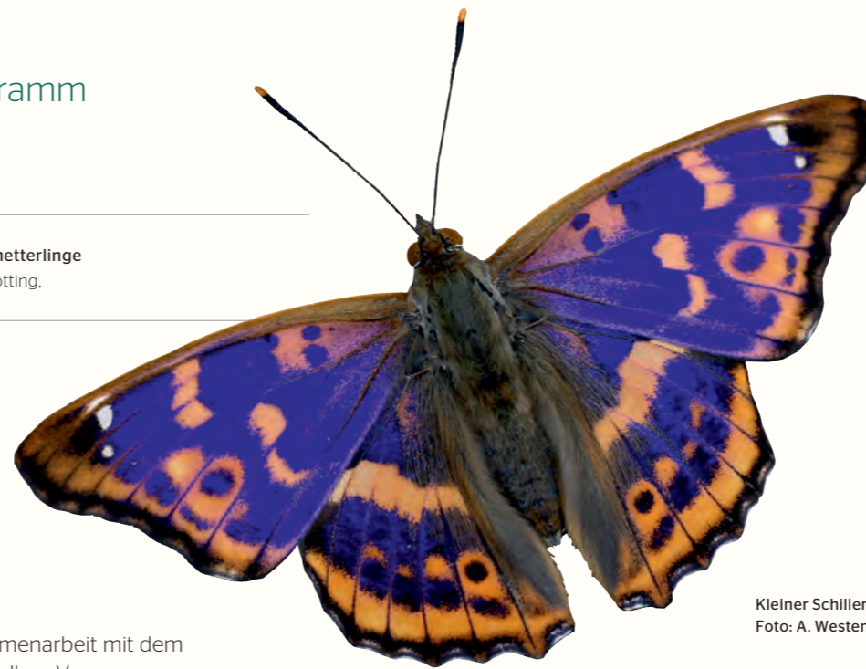
Kleiner Schillerfalter (f. clytie), Foto: A. Westenberger

Links: Bärenspinner, Aquarell: J. Brandstetter