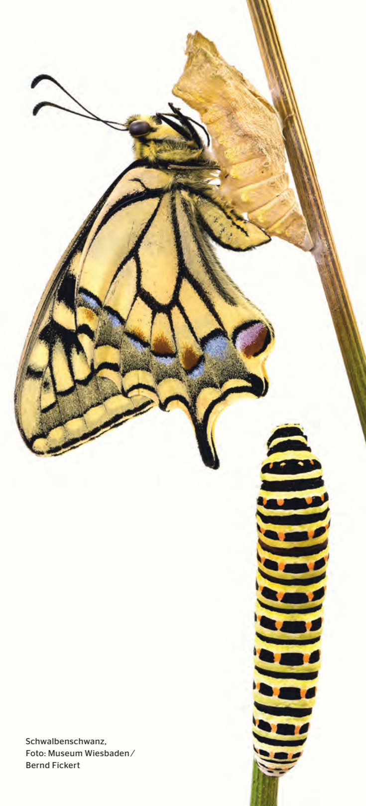
Schwalbenschwanz, Foto: Museum Wiesbaden/ Bernd Fickert